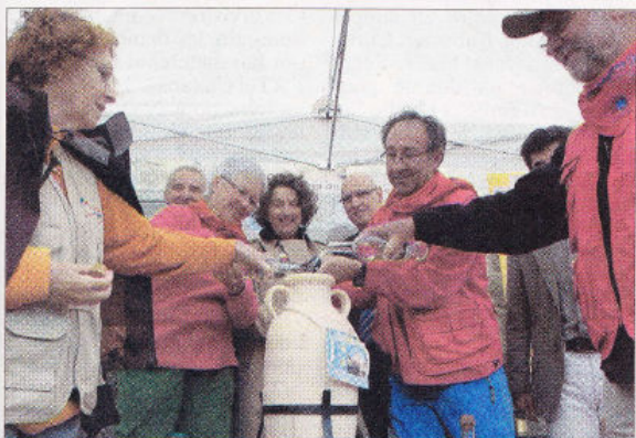
Chaque groupe de randonneurs est venu verser l'eau de sa source dans l'amphore qui partira à Grenade au mois d'octobre.

La thématique de l'eau, retenue pour l'Euroorando 2011, est bien sûr en lien avec le rôle des randonneurs dans la protection de l'environnement.