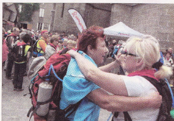
A leur arrivée sur le parvis de la basilique Saint-Nazaire, à la Cité, certains avaient encore des jambes pour danser !